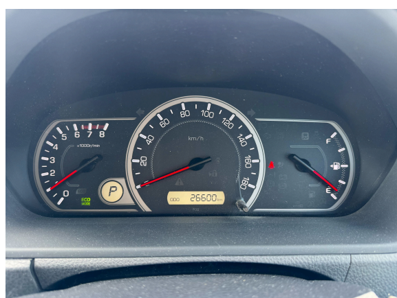
11枚目 メーターパネル