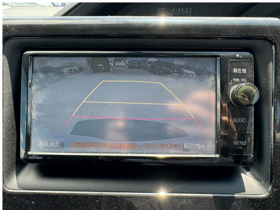
13枚目 バックカメラ（任意）