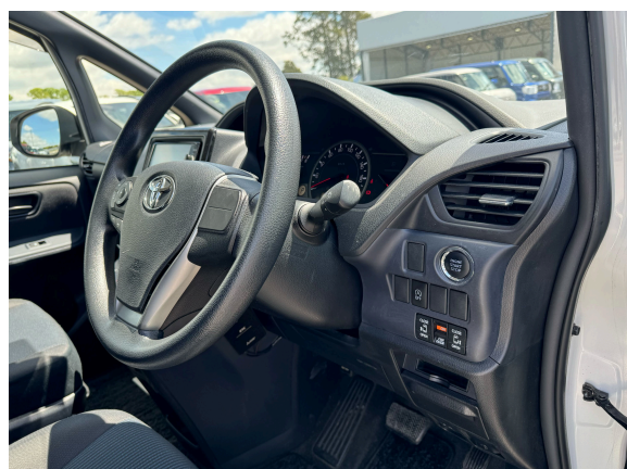
9枚目 エンジンボタンなど