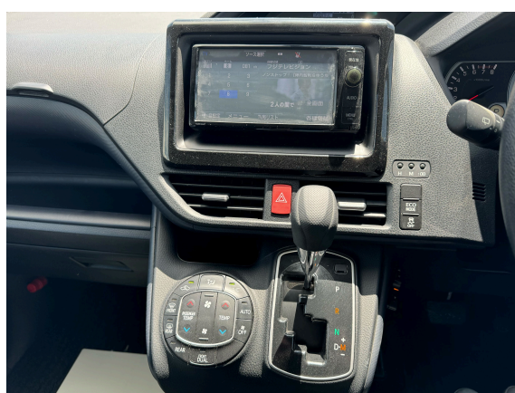
12枚目 モニター・エアコン付近