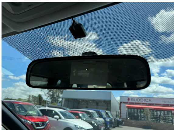
15枚目 ルームミラー