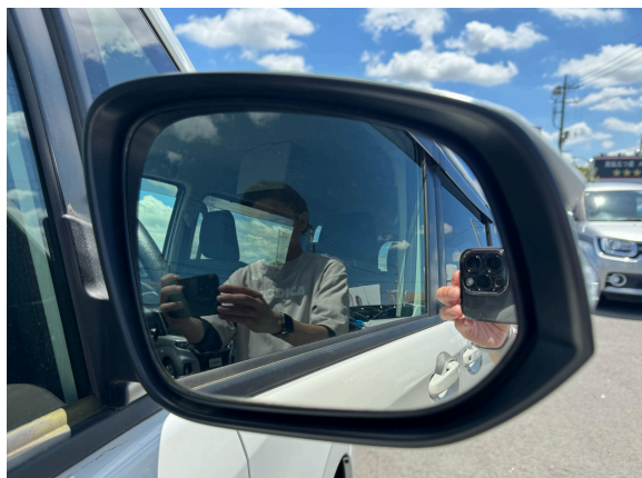
7枚目 ドアミラー（左右どちらか）