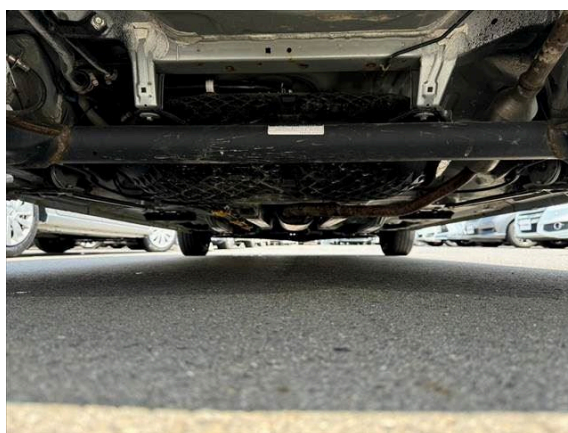
18枚目 下回り（真後ろ）