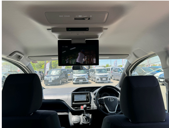
16枚目 フリップダウンモニター（任意）