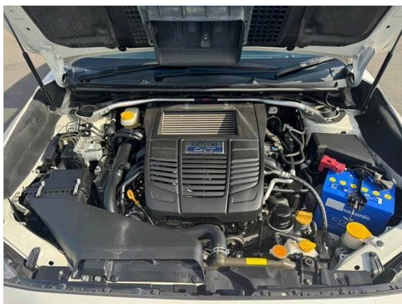
21枚目 エンジンルーム